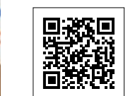
ドローンで見る聖徳大学の動画が流れます