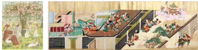
【左】ケイト・グリーンウェイ『ハメルンの笛吹き』1888年等 【右】竹取物語

聖徳博物館 「聖徳大学 収蔵名品展 奈良絵本・絵巻」 利根山光人記念ギャラリー 「イラストレイテッド・ロンドン・ニュースに描かれた幕末・明治の日本」 企画展示ギャラリー 「英国ヴィクトリア朝の絵本」