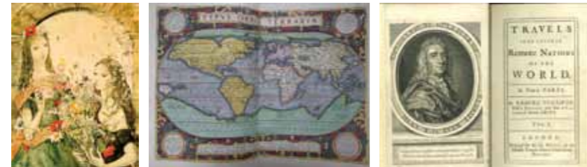
【左】収蔵名品展 藤田嗣治 【中央】オルテリウス『世界の舞台』 【右】スウィフト『ガリバー旅行記』