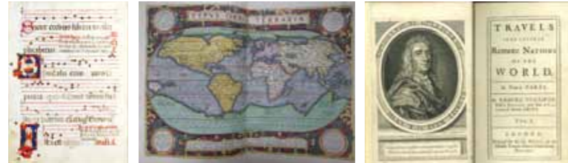
【左】交唱歌13～14世紀イタリア 【中央】オルテリウス「世界の舞台」 【右】スウィフト『ガリバー旅行記』